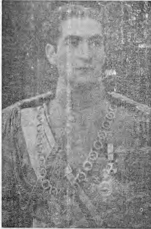
جوان و جوانبخت و دانش پذیر هدوات جوان و بشدیر پیر